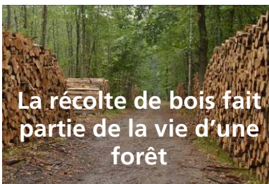
La récolte de bois fait partie de la vie d'une forêt