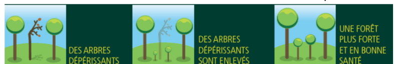
Illustration d'une coupe sanitaire

Ces arbres, principalement des chênes, frênes et châtaigniers dépérissants représentent un danger sérieux pour les promeneurs et usagers des forêts. Les risques de chablis (déracinement) et de chutes de branches seront évités grâce à ces coupes sanitaires diminuant ainsi les dangers pour les promeneurs.