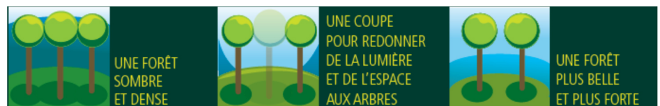
Illustration d'une coupe d'amélioration

Cette coupe est programmée sur une surface de 8,11 hectares pour la parcelle 71.